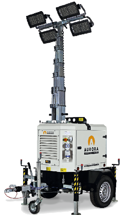
Carrello omologato EU su strada Road tow trailer approved for UE Chariot homologué EU sur route