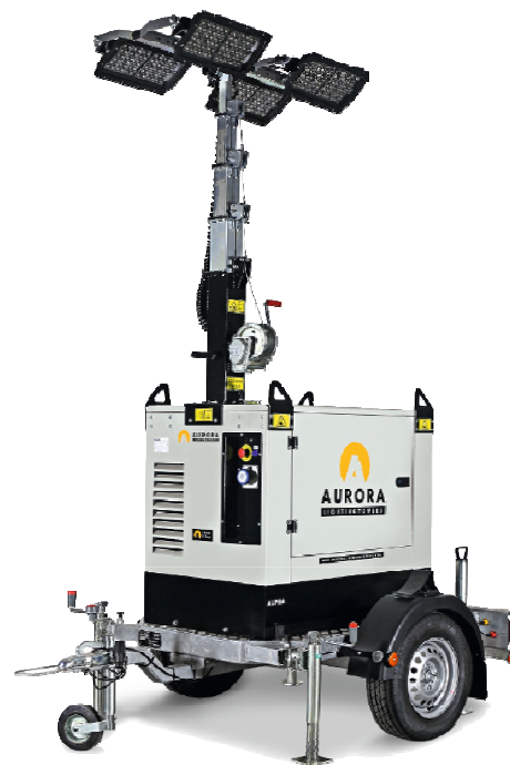
Carrello omologato EU su strada Road tow trailer approved for UE Chariot homologué EU sur route